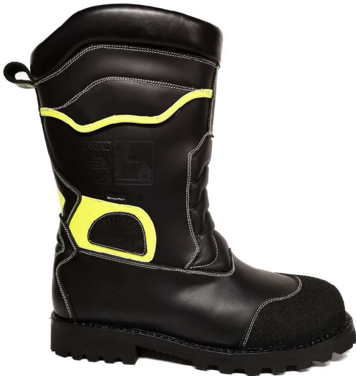
BOTA DE INTERVENCION P-109-FM-PCL2